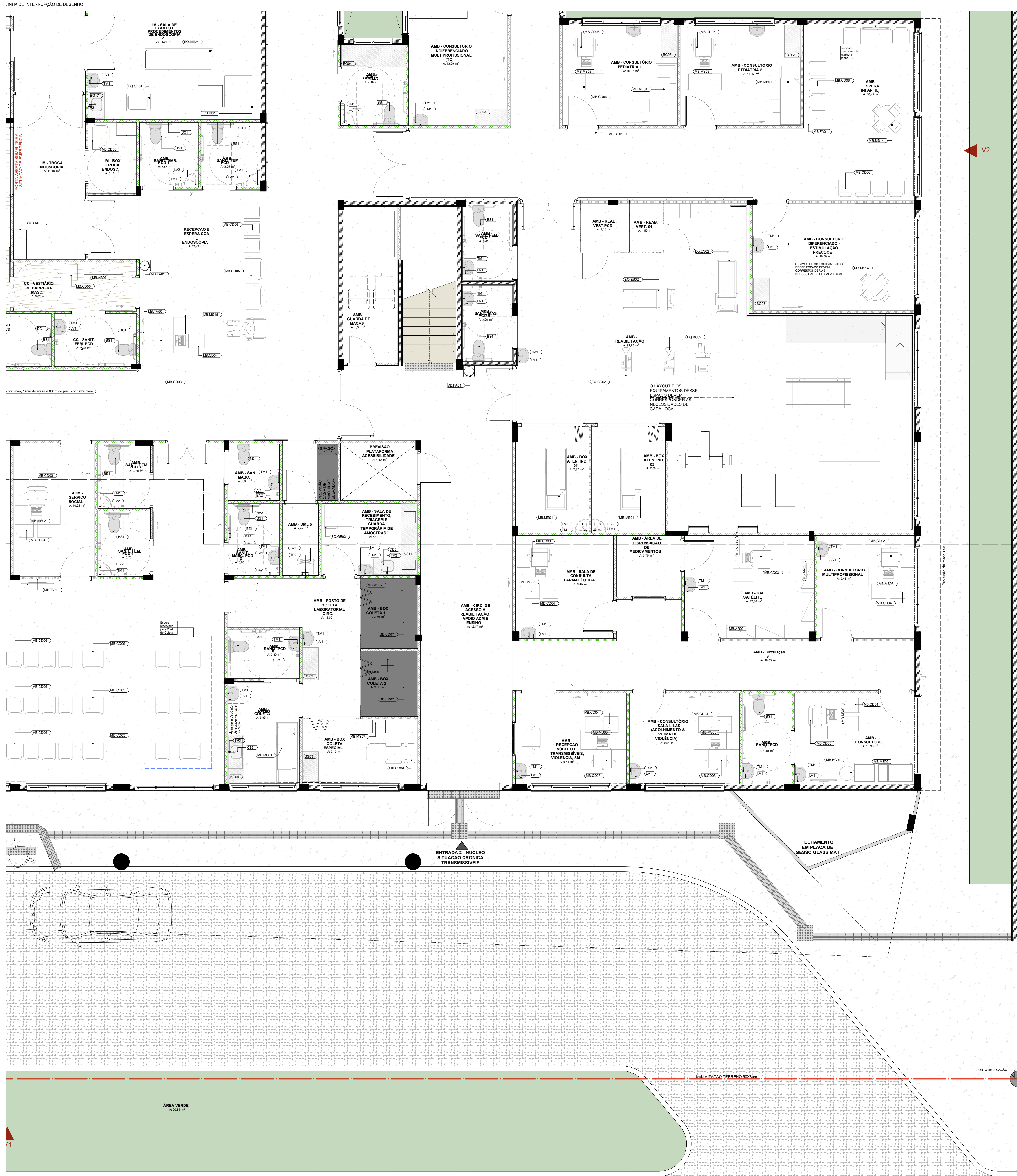
PLANTA DE LAYOUT TÉRREO Esc. = 1:50